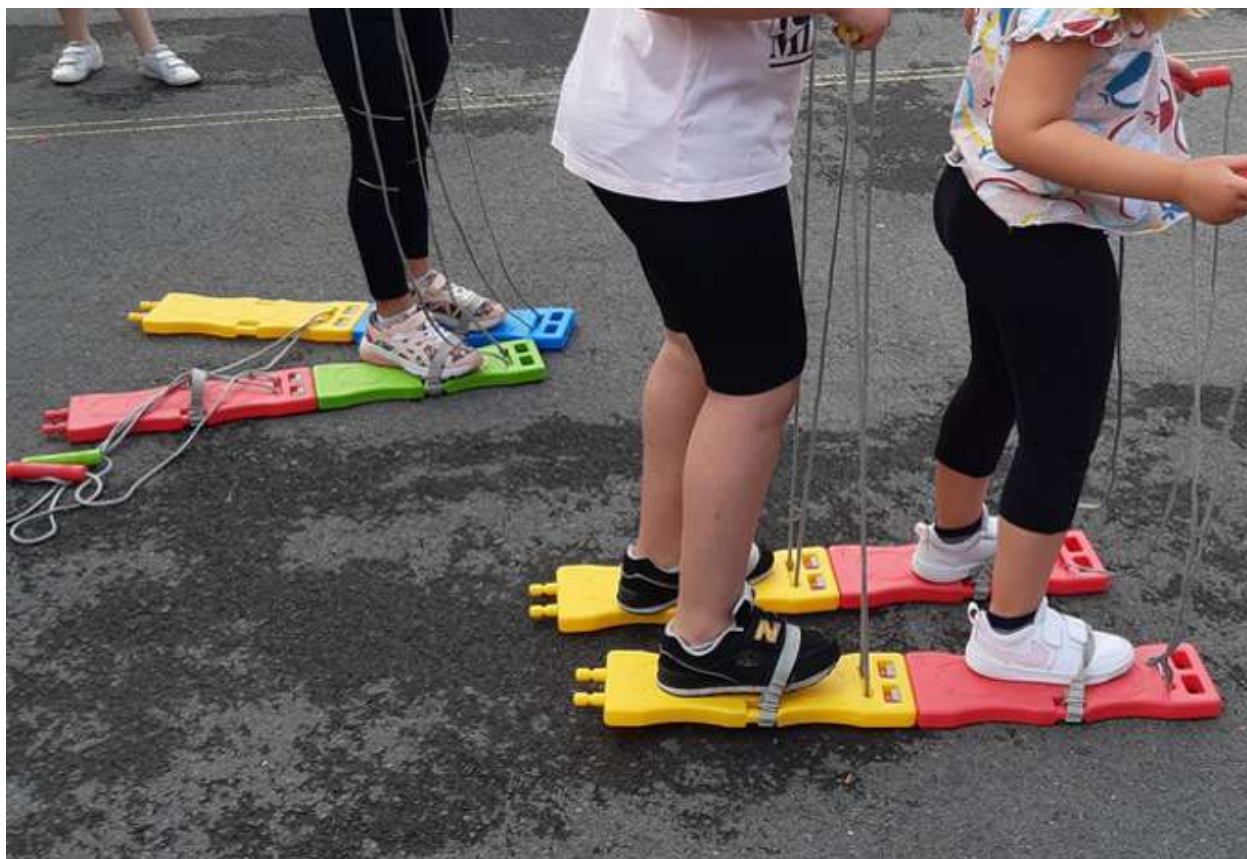
Skier seul, à 2