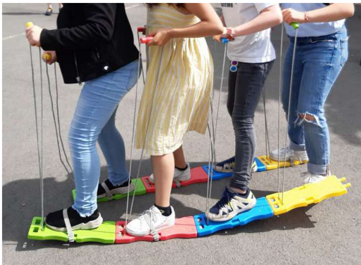
et même à 4!